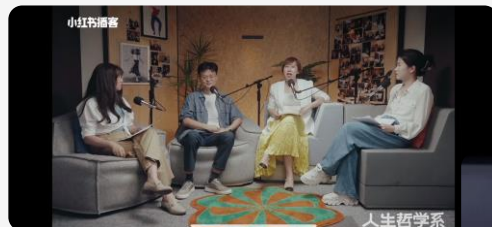
小红书「人生哲学系」长视频播客