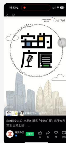
瑞安办公品牌播客 视频预告片