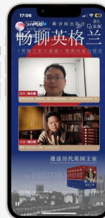
忽左忽右 「畅聊英格兰」