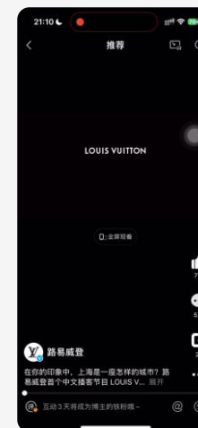
路易威登品牌播客 视频预告