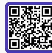
喜马拉雅声音综艺「职者见智」